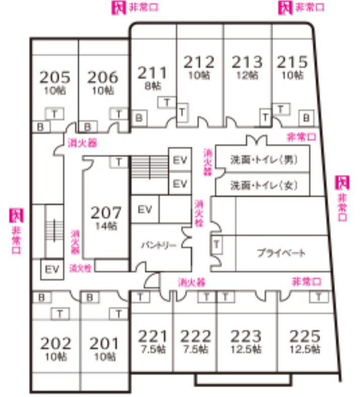
西館 本館 2 F