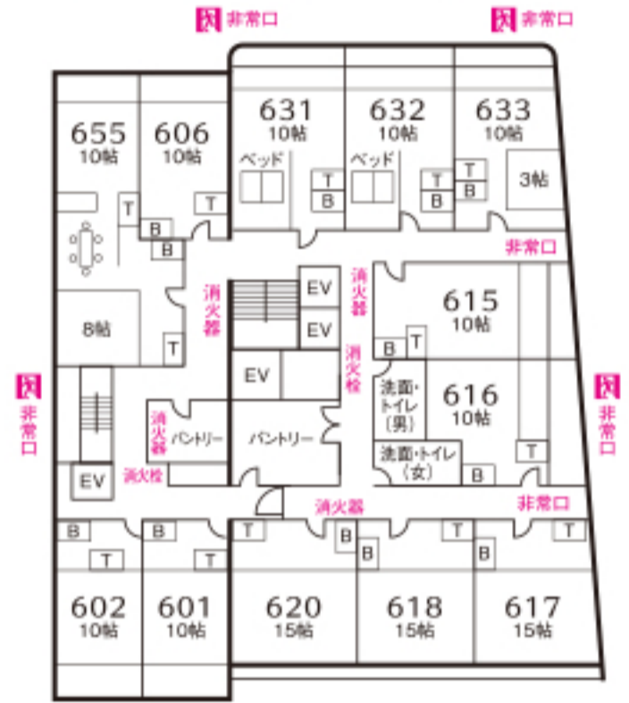
西館 本館 6 F