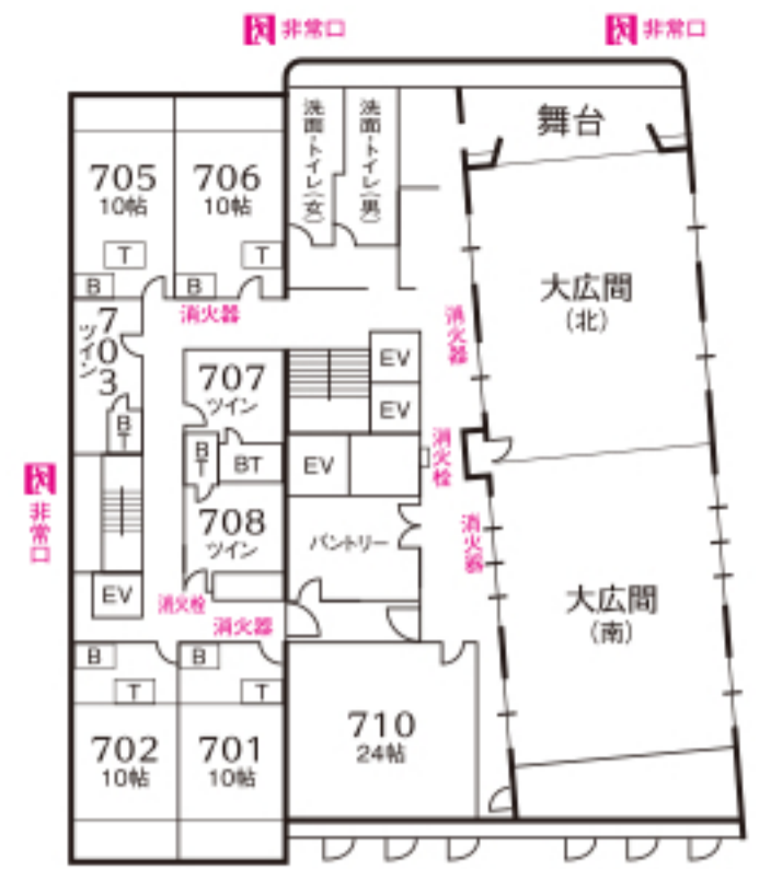
西館 本館 7 F