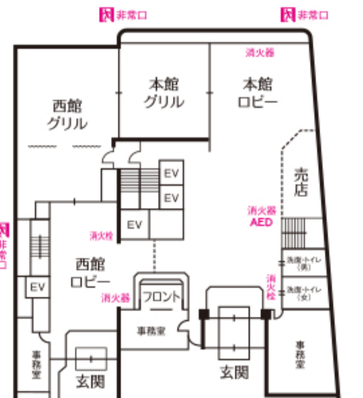
西館 本館 1 F